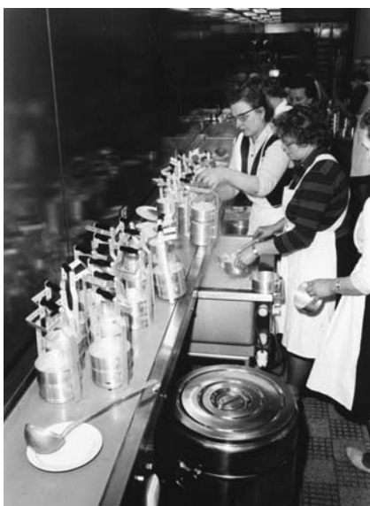
Die Henkelmänner werden befüllt