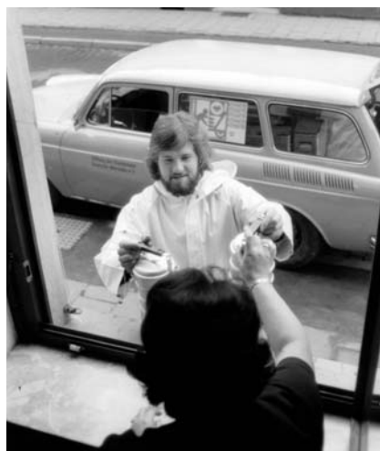
Der Bringdienst direkt durchs Fenster