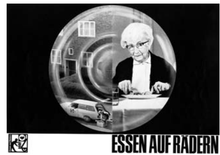
Eine Werbebroschüre aus den späten 60ern