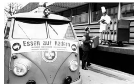
Der Wagen wird beladen