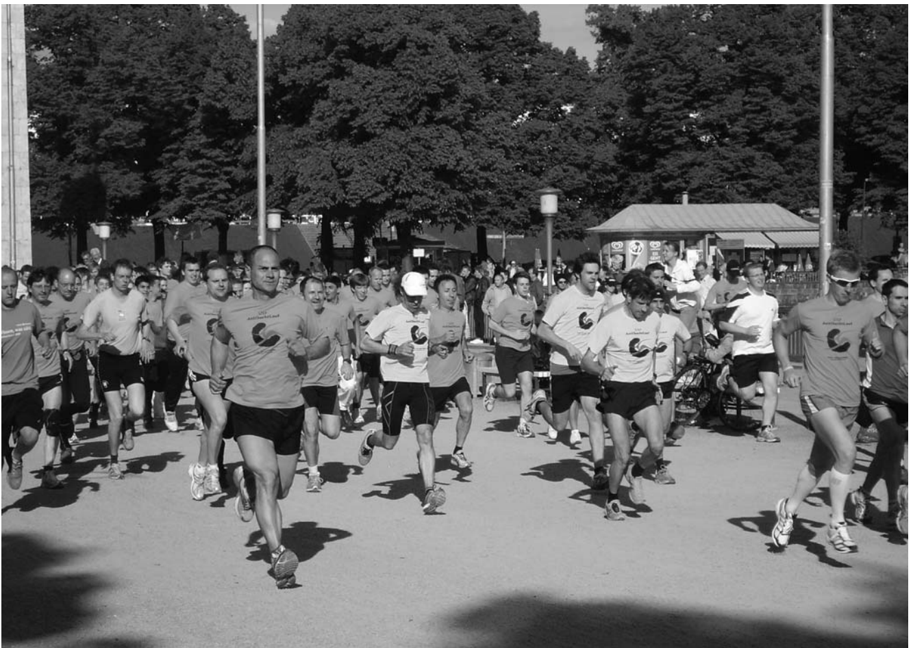
560 Läuferinnen und Läufer starteten zum 6. AntiSuchtLauf um den Maschsee