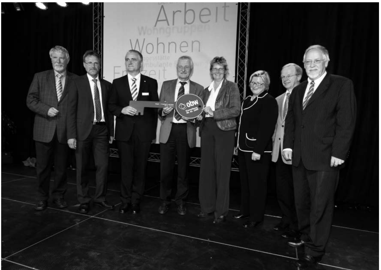
Die Schlüsselübergabe mit der Ministerin und den anderen hochrangigen Gästen