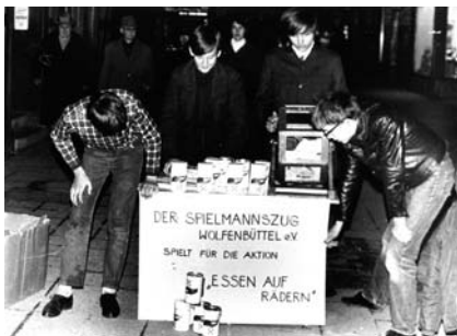
Ein Spielmannzug spielt für Essen auf Rädern