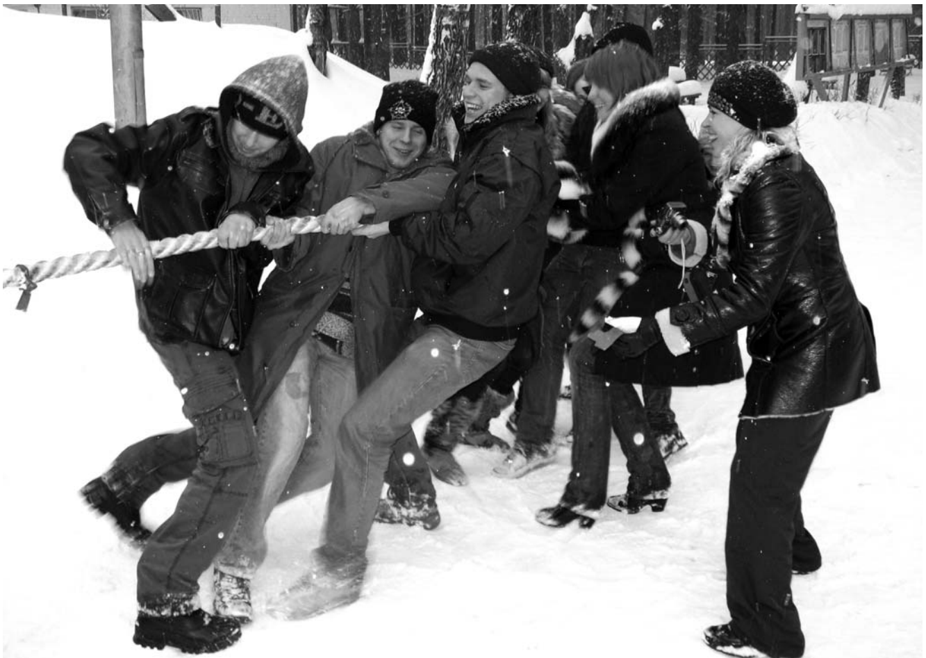
Gemeinsame Aktivitäten: Tauziehen im Schnee