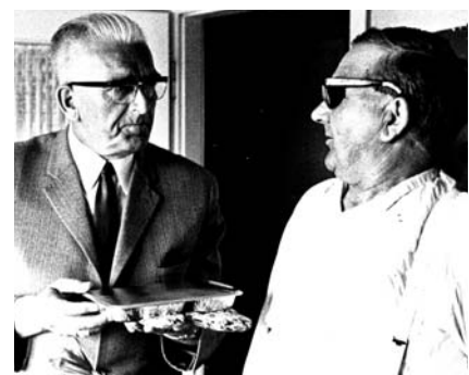
Die 3.000 Portion in Wolfsburg - überreicht vom Bürgermeister