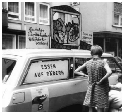
Geschmückter Wagen beim Festumzug